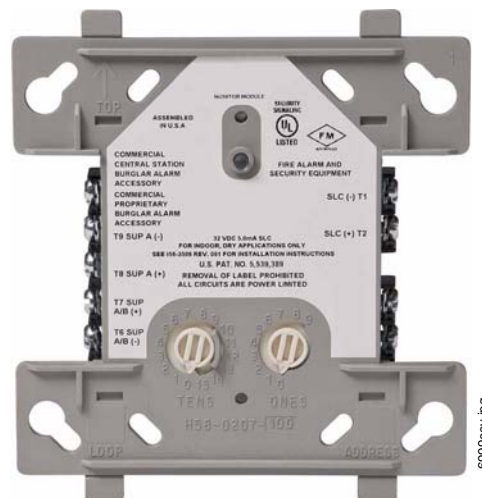
FMM-1 (Tipo H)

El módulo de monitor FMM-1 tiene como objeto usarse en sistemas inteligentes de dos cables, donde la dirección individual de cada módulo se selecciona usando los interruptores giratorios incorporados. Brinda un circuito de dispositivo iniciador (IDC) con tolerancia a fallas de dos o cuatro cables para alarmas contra incendio de contacto generalmente abierto y dispositivos supervisores. El módulo